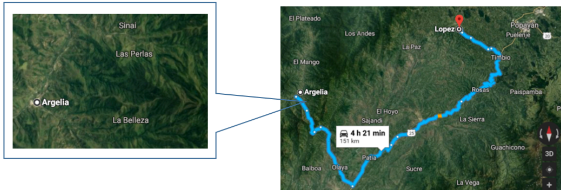
Figura 1. Detalle de Zona de liberación entre las veredas Las Perlas y La Belleza, a 15 minutos de Argelia, Cauca.